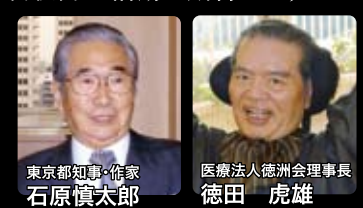
東京都知事・作家 石原慎太郎